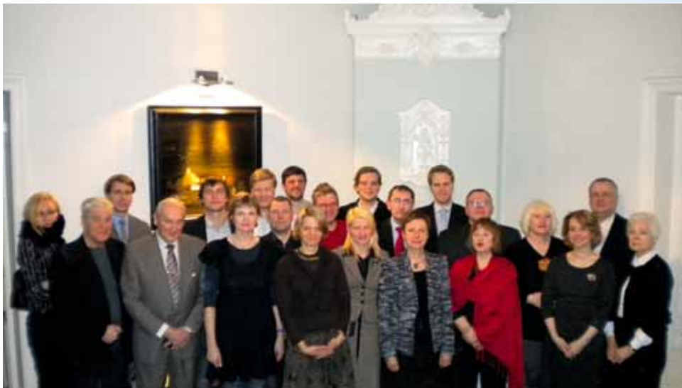
Meierovica biedrības par progresīvām pārmaiņām kopsapulces dalībnieki 2011. gada 29. martā

Šajā ziņā rīkojums Nr.3 vēl ir gaidāms. Pagaisinātie miljardi, valsts parāds, budžeta griešana, starptautisko aizdevēju diktāts un visa sloga uzlikšana pilsoņu pleciem ceļas no valsts nozagšanas, bet nozadzēji dzīvo cepuri kuldami. Tikmēr grūtībās nonākušie aizbrauc no valsts vai parazitē uz minimāliem pabalstiem. Ir nepieciešamas simboliskas tiesas un gudri pasākumi, kas ierobežotu līdzekļu apstākļos atjaunotu cilvēkos strādātsparu un ticību valstij. Progresīvas pārmaiņas šobrīd radāmas šajos virzienos.