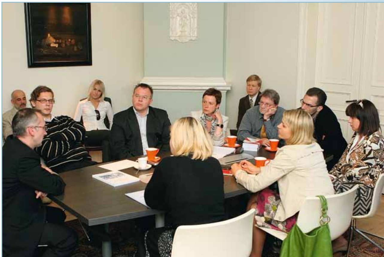
Diskusija Meierovica biedrībā par korupcijas novēršanu un apkarošanu 2010. gada 17. jūnijā