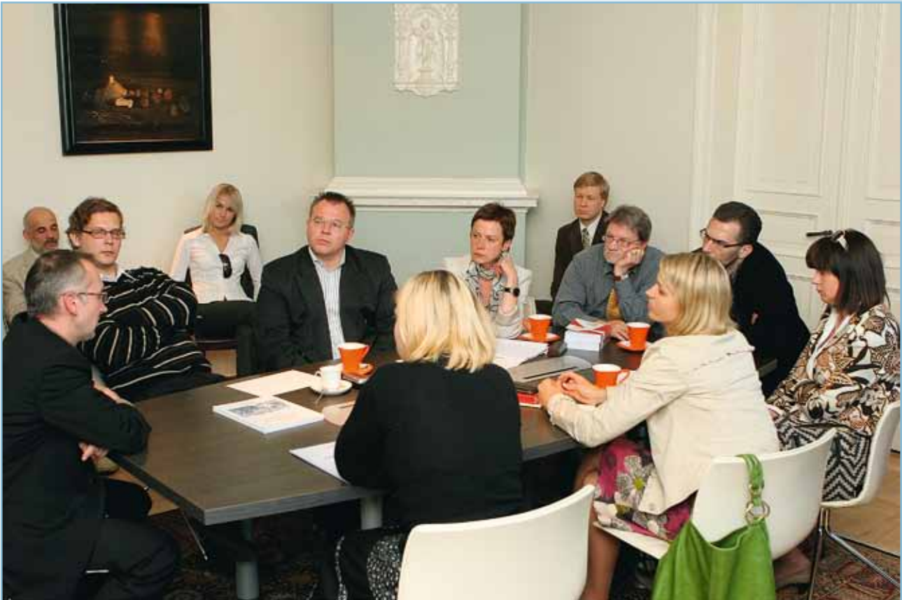
Diskusija Meierovica biedrībā par korupcijas novēršanu un apkarošanu 2010. gada 17. jūnijā